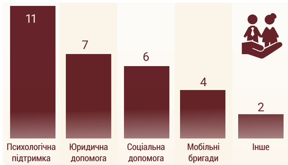
Діаграма 2. Типи допомоги, яку надають організації.